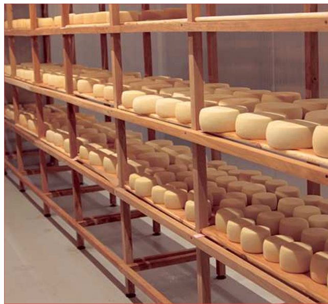
На снимках: технологическое оборудование; сыр Белпер Кнолле в процессе приготовления; головки сыра Томм (на верхней полке) и Качотта (на нижней) на созревании.

оборудование. Однако все эти сверкающие новизной приборы и оборудование - лишь инструменты в руках мастера. Чтобы получить сыр нужной марки требуются всего три компонента: молоко, заквасочная культура и фермент.