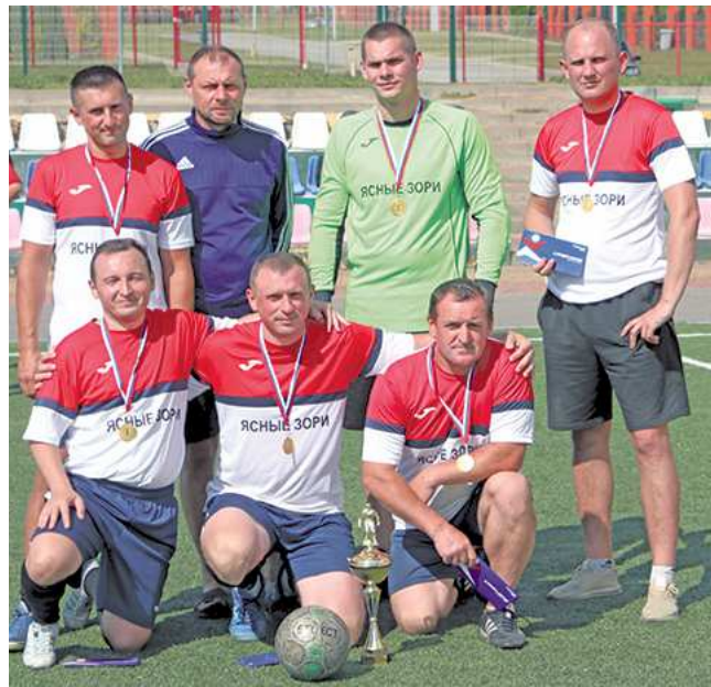
На снимках: момент атаки футболистов аппарата управления; победители турнира.

птицеводов и молочников. Но руководители отраслей не смогли собрать команды даже для мини-футбола.