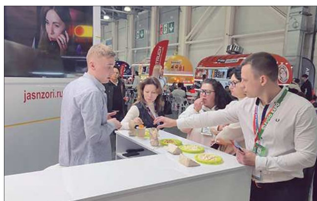
Дегустация сыров собрала много положительных отзывов о нашей молочной продукции

С 19 по 21 марта в Москве в выставочном центре «Крокус Экспо» прошла десятая юбилейная выставка для профессионалов ритейла и гостинично-ресторанного бизнеса Food Expo. Её участниками стали более 100 компаний из России, а также поставщики из Турции, Китая, Индии, Ирана и стран СНГ.