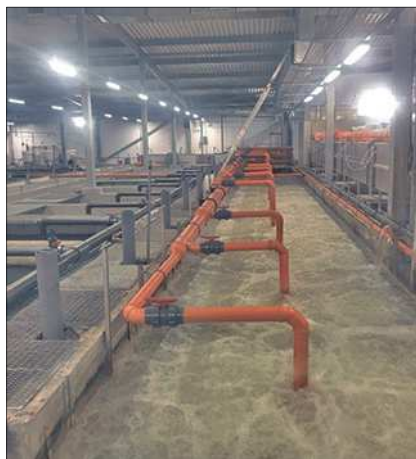
Рыбоводческий комплекс «Янтарный ручей», Ульяновская область

рыбоводческом комплексе - «Янтарный ручей» в Ульяновской области.