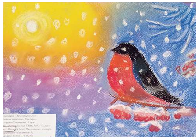
«Снегирь», автор - Елизавета Мальцева

Первое место в возрастной категории 14-17 лет занял