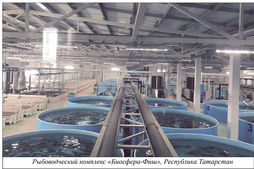
Рыбоводческий комплекс «Биосфера-Фиш», Республика Татарстан