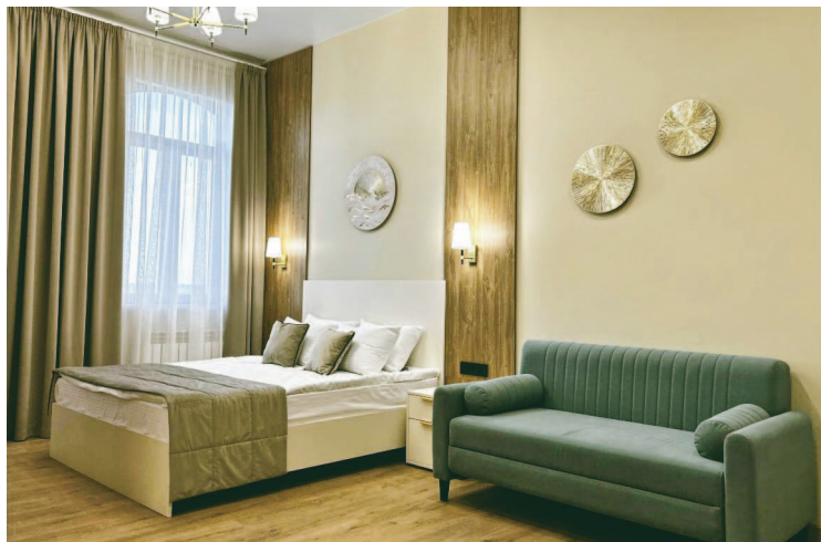
На снимке: гостиничный номер в АБК.