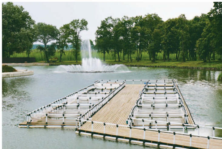
На снимке: садки со стерлядью и фонтан на Нижнем пруду.