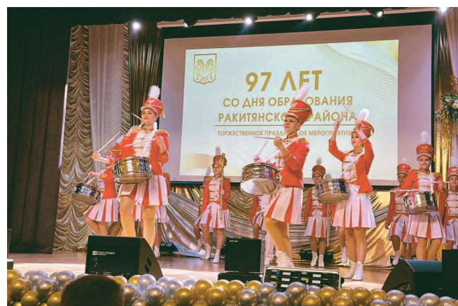
На снимке: праздничный концерт.