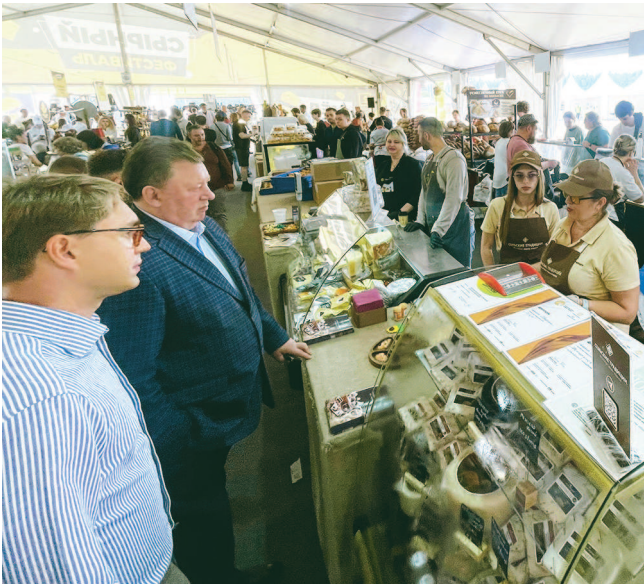
(Продолжение на 4-й стр.)

Несмотря на прошедший в первый день ливень, юбилейный фестиваль в Истре прошёл ярко и насыщенно, подтвердив свой статус одного из ключевых событий аграрных мероприятий в России.