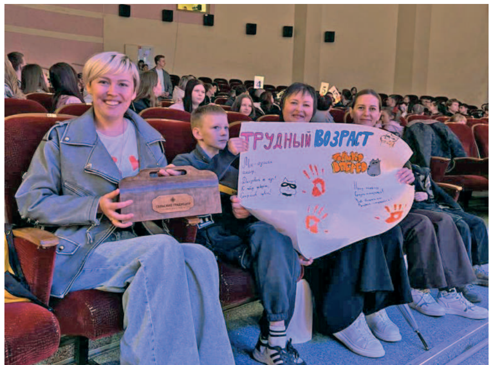
Группа поддержки команды-участницы финала «Трудный возраст» из Солдатской СОШ, взявшей бронзу юмористических соревнований, и болельщица, которая полу-чила специальный приз, подготовленный агрохолдингом, с набором натуральных сыров из козьего и овечьего молока от торговой марки «Сельские традиции».