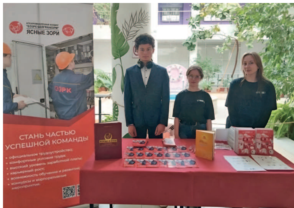
Амбассадоры агрохолдинга на Дне открытых дверей в Белгородском ГАУ.

Сотрудничество агрохолдинга «БЭЗРК-Белгранкорм» с образовательными организациями — это системная работа, направленная на повышение качества подготовки специалистов и укрепление связи теоретического обучения с реальным сектором производства. Наша компания стремится создавать не только рабочие места, но и возможности для роста, развития и реализации потенциала каждого молодого сотрудника, формируя тем самым кадровый резерв и обеспечивая процветание аграрной отрасли в целом.