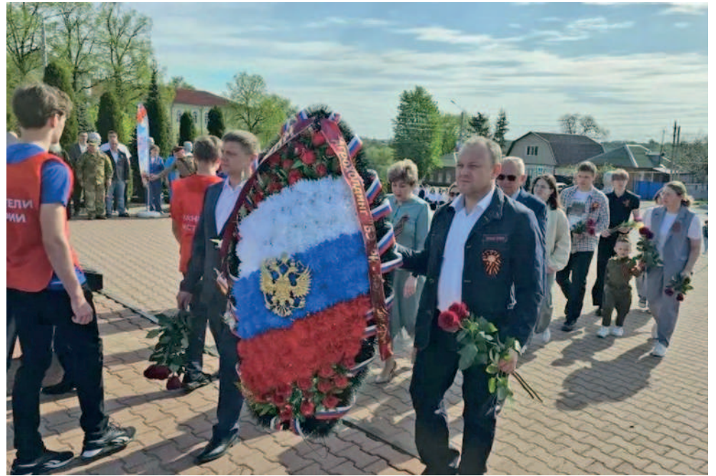
Сотрудники холдинга на возложении в посёлке Ракитное.