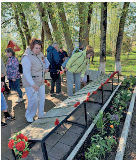
Работники «ПКХП» возлагают цветы у Подберезского братского захоронения.

В рамках этих инициатив, как и в предыдущие годы, была оказана значительная адресная помощь ветеранам Великой Отечественной войны, вдовам участников, а также сотрудникам холдинга, имеющим статус ветеранов боевых действий, участникам контртеррористических операций и членам их семей. Всего компания выделила на эти цели 195 продовольственных наборов, которые были вручены в Белгородской и Новгородской областях, став символом нашей благодарности и заботы о тех, кто ценой не-