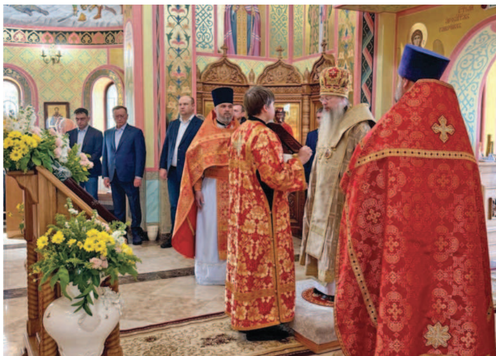
Богослужение в храме Святого Благоверного великого князя Александра Невского.