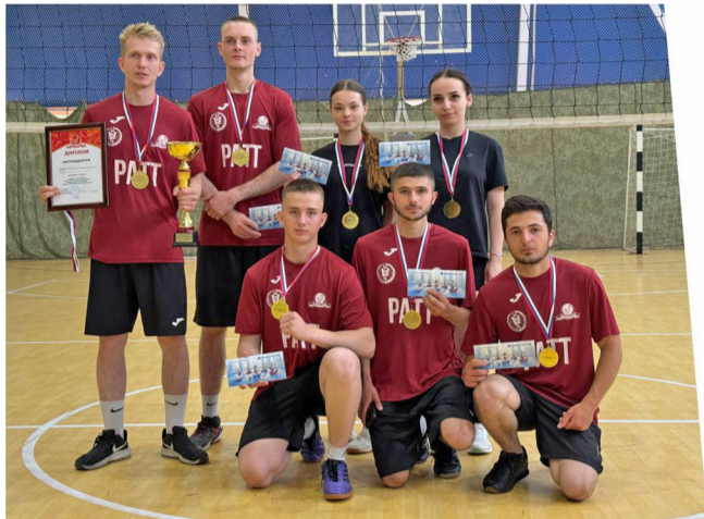
Команда Ракитянского агротехнологического техникума (1 место).

В мае спортивная жизнь нашего агрохолдинга заиграла новыми красками. На протяжении двух суббот, 23 и 30 мая, в посёлке Пролетарский на базе Физкультурно-оздоровительного комплекса «Спартак» проходил турнир по волейболу. Соревнования были приурочены к 81-й годовщине Победы в Великой Отечественной войне.