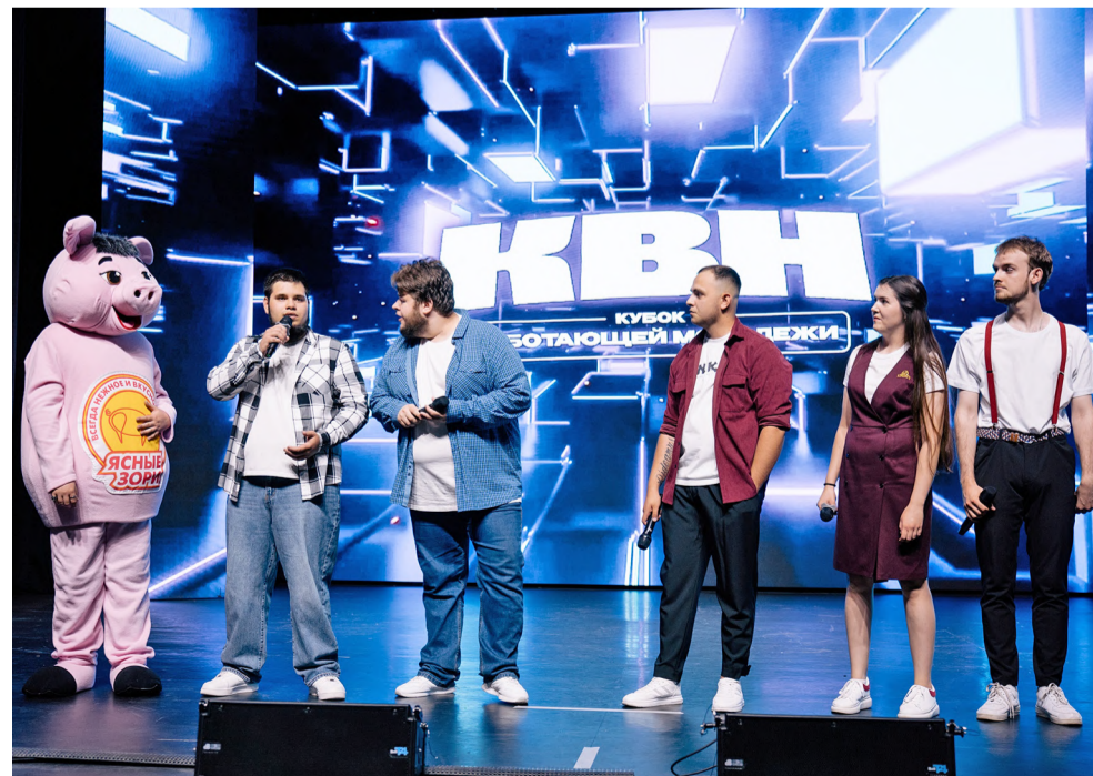
Сборная команда агрохолдинга «БЭЗРК-Белгранкорм» и работников культуры.

Все участники сыграли конкурс «Приветствие», по итогам которого жюри приняло решение, что победителем Кубка работающей молодёжи стала команда Яковлевского ГОКа «Аномалия».