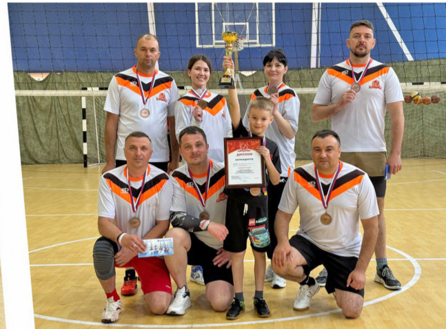
Команда отраслей свиноводства, молочного и мясного животноводства (3 место).