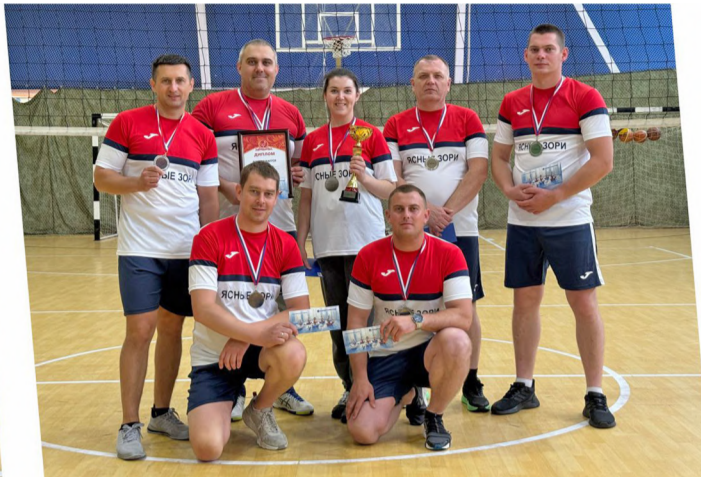
Команда аппарата управления (2 место).