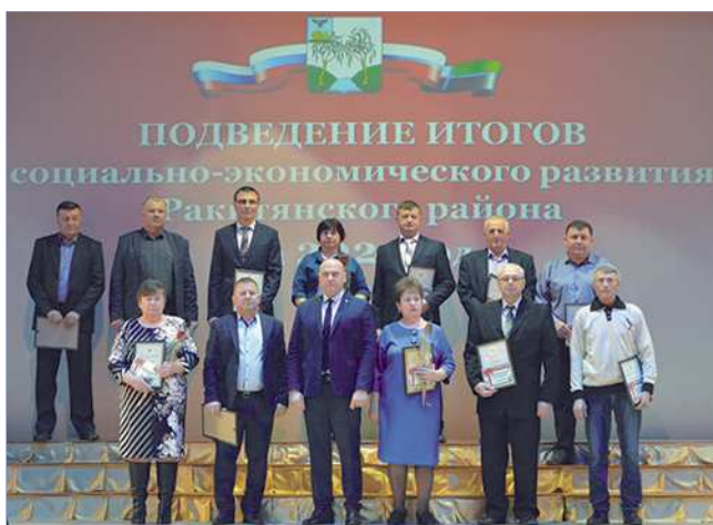
На снимке раkitяницы, получившие Благодарности Министерства сельского хозяйства РФ, среди которых и наши коллеги.

мероприятие по подведению социально-экономических итогов Ракитянского района за 2022 год.