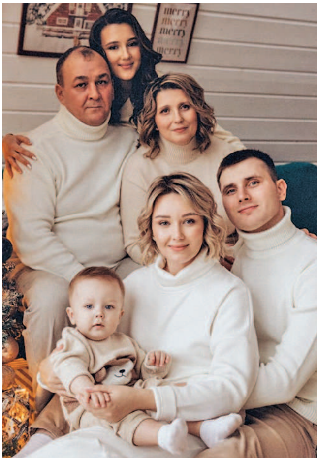
На снимке: большая и дружная семья Слугиных.

8 июля в России празднуется День семьи, любви и верности. В этот день мы отмечаем память святых Петра и Февронии, символов крепкой любви и верности, которые в веках вдохновляют людей на создание гармоничных и счастливых семей. В нашем агрохолдинге работает много семейных пар, каждая из которых является ярким примером любви и взаимопонимания. Их истории — это замечательные примеры того, как два сердца, соединяясь в семью, обретают счастье и гармонию. Мы гордимся тем, что в нашем холдинге работает много счастливых семейных пар, которые делятся с нами своим теплом и любовью. Семья — это самая важная ценность в жизни каждого человека, она помогает справляться со всеми трудностями и является стимулом для новых достижений не только личного характера, но и в работе. В преддверии праздника мы пообщались с нашими коллегами, которые поделились своими мыслями о том, что делает семью такой ценной и важной.