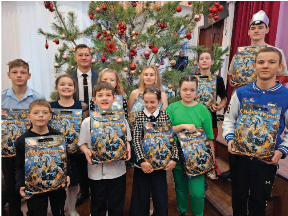
Заместитель генерального директора компании «Имение Хвостовых» после утренника с воспитанниками Специальной школы-интернат (г. Задонск).

Сохраняя многолетние традиции и стремясь подарить праздник каждому ребёнку, наш агрохолдинг в канун 2026 года провёл масштабную предновогоднюю кампанию. Мы подводим итоги этой работы и вспоминаем самые яркие моменты ушедшего декабря.