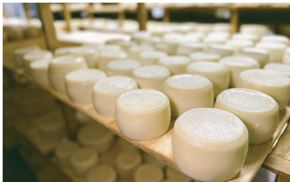
На снимке: сыр в камере созревания.