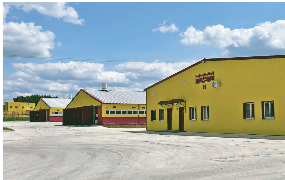
На снимке: производственные корпуса цеха по содержанию мелкого рогатого скота (Сажное).

Продукция «Сельских традиций» — это результат любви к природе, уважения к традициям и неустанного труда.