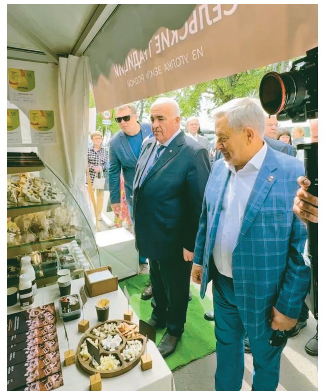
На снимке: губернатор Костромской области С.К. Ситников (в центре) у нашего выставочного павильона.

чтобы вновь порадовать гурманов нашей продукцией и продолжить славные традиции агрохолдинга «БЭЗРК-Белгранкорм»!