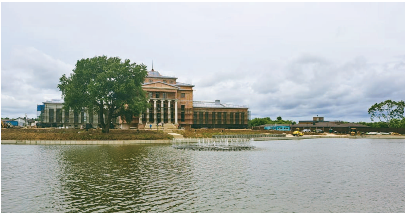
На снимке: главный усадебный комплекс с фонтаном на переднем плане.

Выборы депутатов в Белгородскую областную Думу восьмого созыва пройдут 12-14 сентября 2025 года.