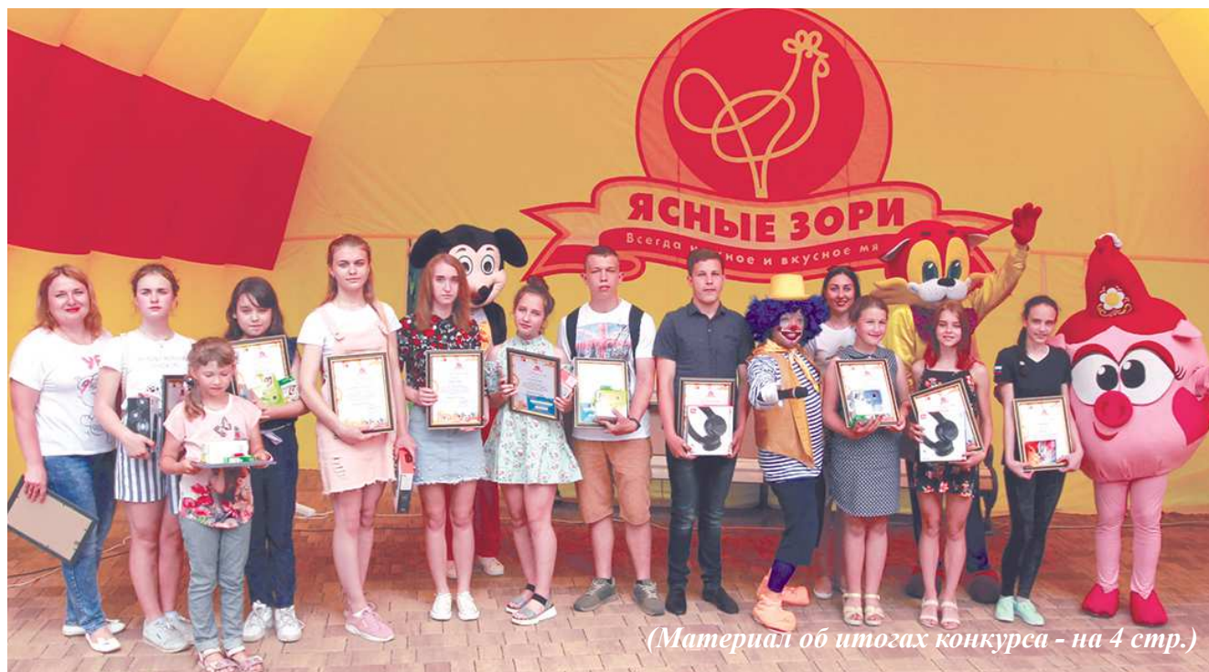
(Материал об итогах конкурса - на 4 стр.)

Ко Дню защиты детей приурочил отдел социального развития компании большое праздничное мероприятие «Дети - будущее нашей компании» в парке культуры и отдыха «Ясные Зори». Состоялось оно в субботу, 8 июня. Обширная праздничная программа включала в себя выступление кукольного театра «Рукавичка» (г.