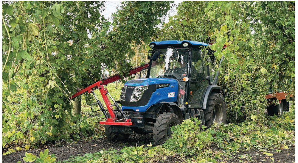
На снимке: срезка лиан.

Весной следующего года планируется высадка ещё двух перспективных сортов. Площадь весенней посадки поставит 9,9 гектара. Итого, с учётом новых плантаций, а также ремонта предыдущих хмельников, в 2026 году уборка хмеля будет производиться уже на 47,26 гектара.