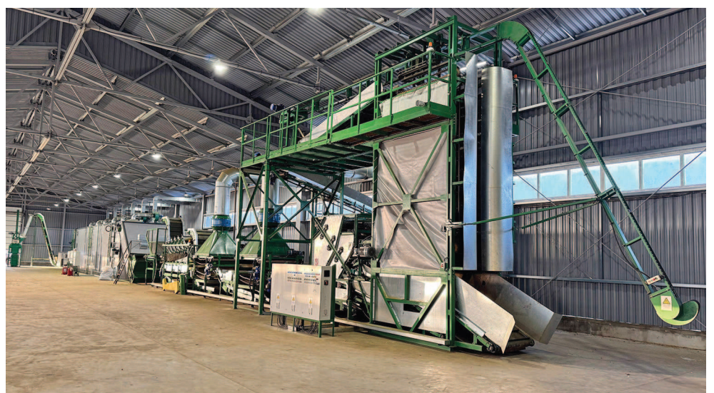
На снимке: хмелеуборочный комплекс.