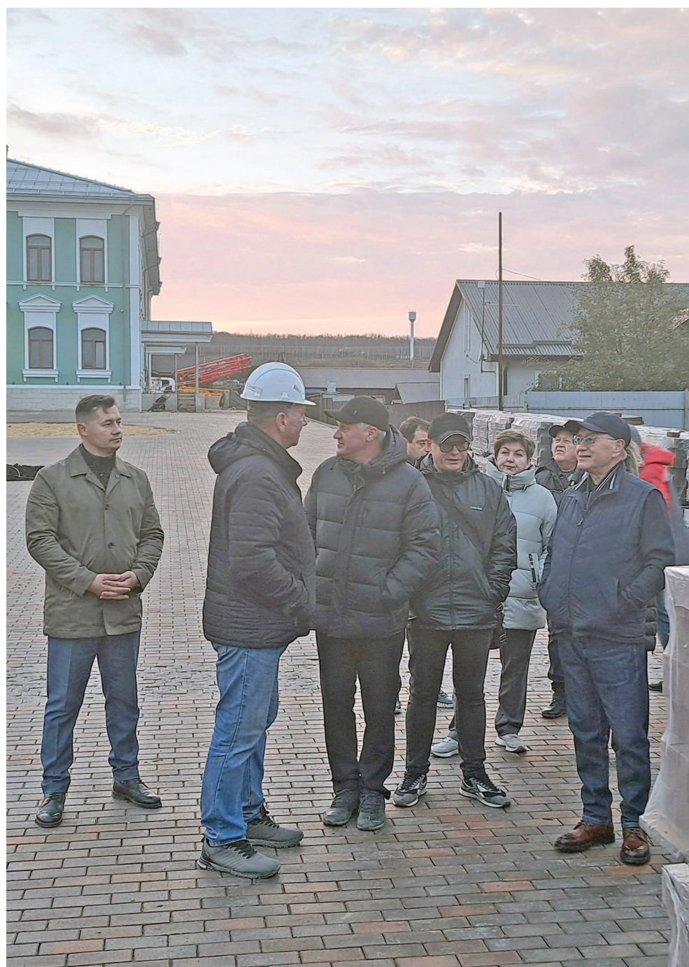
На снимке: производственное совещание в «Имени Хвостовых».

Обсуждались вопросы хмелеводства, рыбобоводства, а также связанные с масштабной стройкой — возведением главного усадебного комплекса, в котором расположится гостиница и медицинский спа-комплекс.