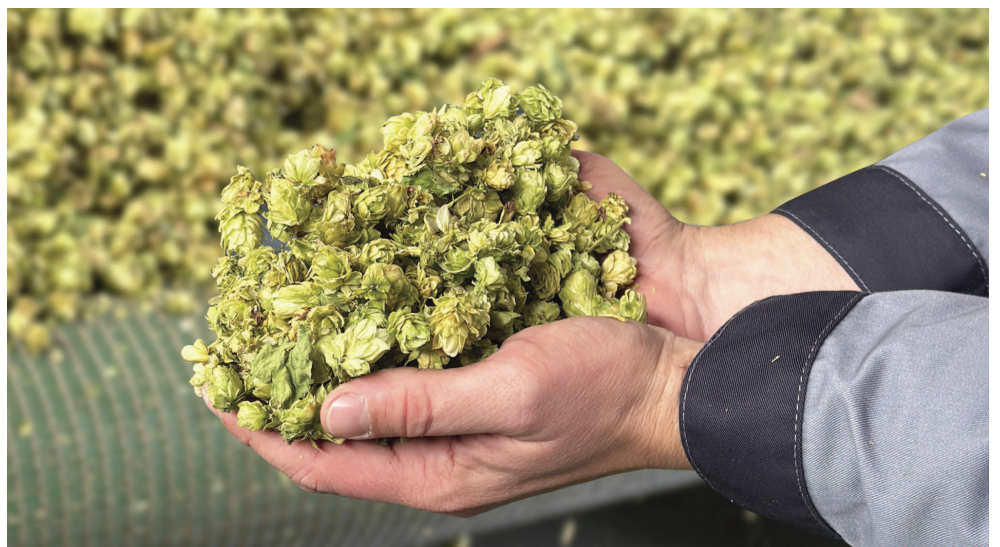
На снимке: урожай 2025 года.