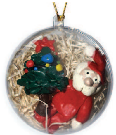
Ёлочная игрушка, выполненная из пластилина, «В ожидании новогоднего чуда!» Михаила Фидиёва (номинация «Новогодняя фантазия»), 1 место.