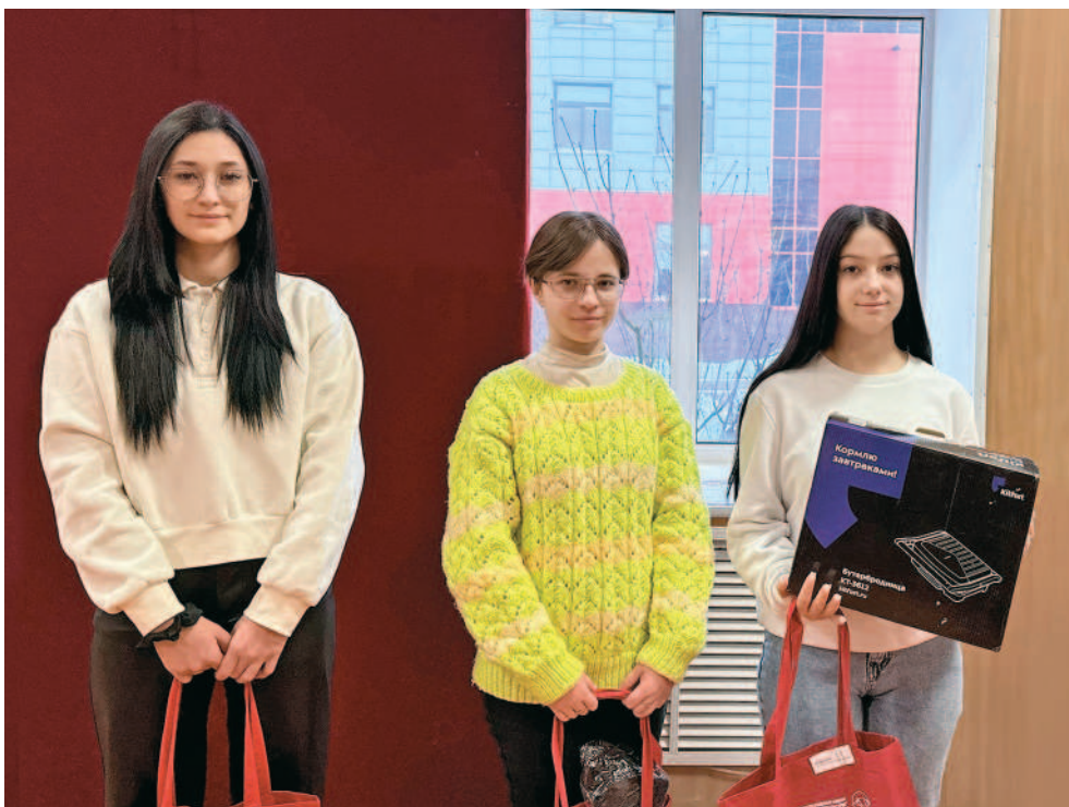
Счастливицы розыгрыша от агрохолдинга из Ракитянского агротехнологического техникума.

Студенчество — время оригинальных идей и, конечно, искренней веры в удачу. В этом году агрохолдинг «БЭЗРК-Белгранкорм» решил поддержать студентов и организовал масштабный розыгрыш призов, посвящённый Дню российского студенчества. Акция прошла при тесном сотрудничестве с ведущими учебными заведениями Белгородской области, выпускающими специалистов аграрных и инженерных специальностей.